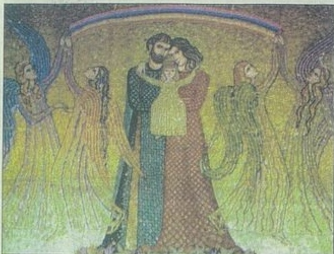
"Hymne à la famille de la Sainte-Marie enfant" : une des fresques en mosaïque de cette artiste russe.

► Le château-musée de Cabriès, nid d'aigle d'Edgar Mélik qui abrite les peintures murales et la collection permanente de l'artiste, présente, avant l'exposition de l'été consacrée au "Pop'Art", un ensemble remarquable de mosaïques monumentales de Larissa d'Odessa-Perekrestova. Inaugurée en présence de Valentina B. Fedorova, responsable au ministère de la Culture Russe, accueillie par le maire de Cabriès, l'exposition invite à découvrir les florilèges d'un art quasi-oublié en Occident.